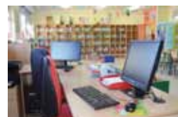
Skolan fortsätter att digitalisera sina läromedel.

har fortsatt att vägleda personalen i att använda nya hjälpmedel som smart pen och talböcker. Några av våra lärare har fortbildat sig och en ny förvaltningschef tillträdde under hösten, liksom en ny rektor/förskolechef i Frostviken.