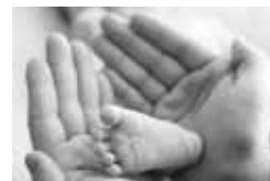
Hjälp för dem som själva inte kan ta tillvara sin rätt.

Vårt uppdrag: Ska årligen granska verksamhet i styrelser, nämnder och kommunägda bolag. Revisionens uppgift är att pröva om kommunen sköter sin verksamhet på ett ändamålsenligt sätt, om räkenskaperna är rättvisande och om den interna kontrollen som görs inom nämnderna är tillräcklig.