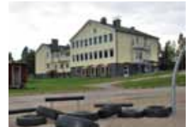
Renoverad skola i Hoting.

Vårt uppdrag: Sköter drift och underhåll av kommunens fastigheter, va-anläggningar, gator, vägar och parker. Gör utredningar, projektering och upphandling samt genomför ny-, om- och tillbyggnad av