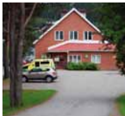
Det finns planer på en flytt av hälsocentralen i Gäddede.

➤ Vi har börjat att se över möjligheten att flytta hälsocentralen till centrala Gäddede efter ett beslut i närvårdsnämnden. Alla trygghetslarm utom två, som saknar mobil täckning, är nu digitala. Arbetsmiljöfrågor har haft särskilt